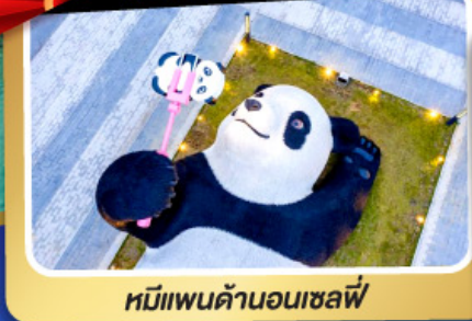
หมีแพนด้าอนเซลฟ์