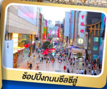
ช้อปปิ้งถนนซีลชีลู