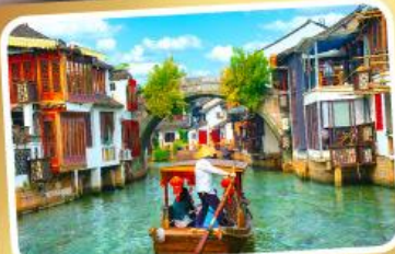
ล่องเรือเมืองโบราณซูโจวเจียเจียว