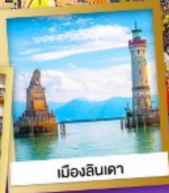
เมืองลินเดา