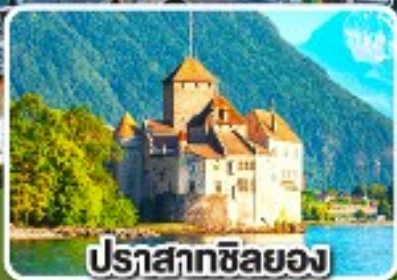
ปราสาทซิลยอง