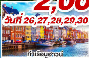
ท่าเรือฮาวน์