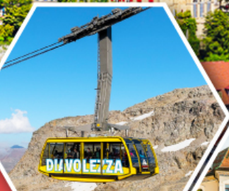
กระเช้าดีอาโวลูเซซ่า