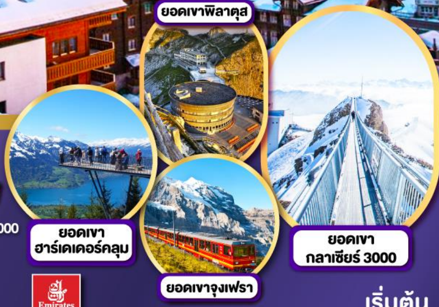
ยอดเขาพิลาคตุส