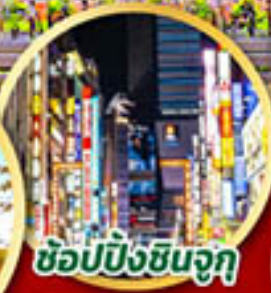
ซ้อปั้งชินจุกุ