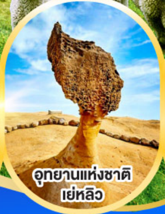
อุทยานแห่งชาติ เยหลิว