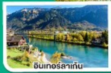
อินทอร์สทัท