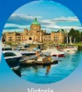
Victoria, British Columbia (Canada)