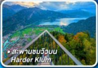
• สพานชมวิวน Harder Klum