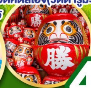
เที่ยวเต็มทุกวันไม่มีฟรีดิย์