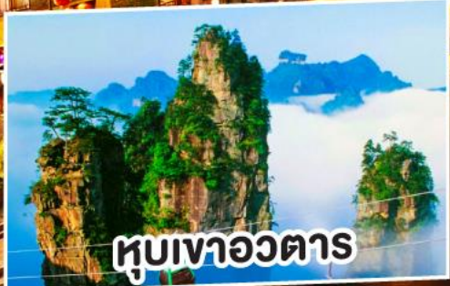
หุบเขาอวตาร