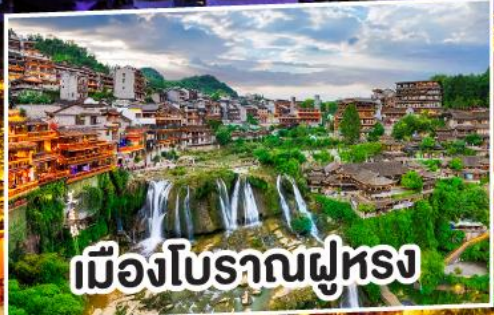
เมืองโบราณผู้ทรง