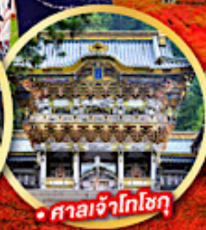
• ศาลเจ้าโกโซกุ