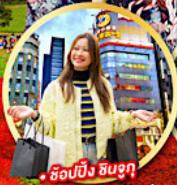
• ช้อปปิ้ง ซินจูกุ

กิจกรรมใส่ชุดกิโมโน พร้อมชมโชว์การแสดงต่างๆ