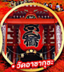
• วัดคาสากุสะ