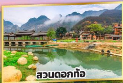
สวนดอกท้อ