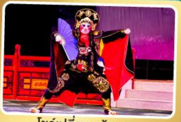
โชว์เปลี่ยนหน้ากาก