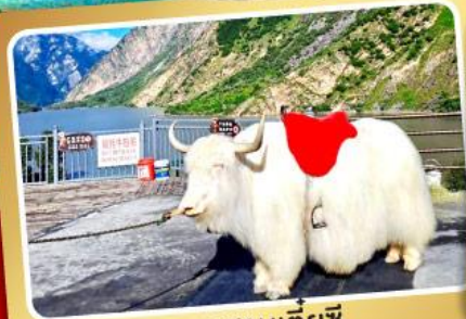
ทะเลสาบเตยซี