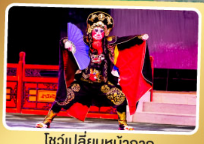
โชว์เปลี่ยนหน้ากาก