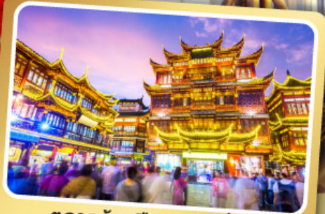
ตลาดร้อยปีเจิ้งหวงเมี่ยว