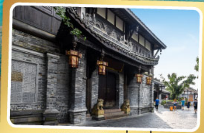
ถนนควานโจ๋เซียงจื่อ