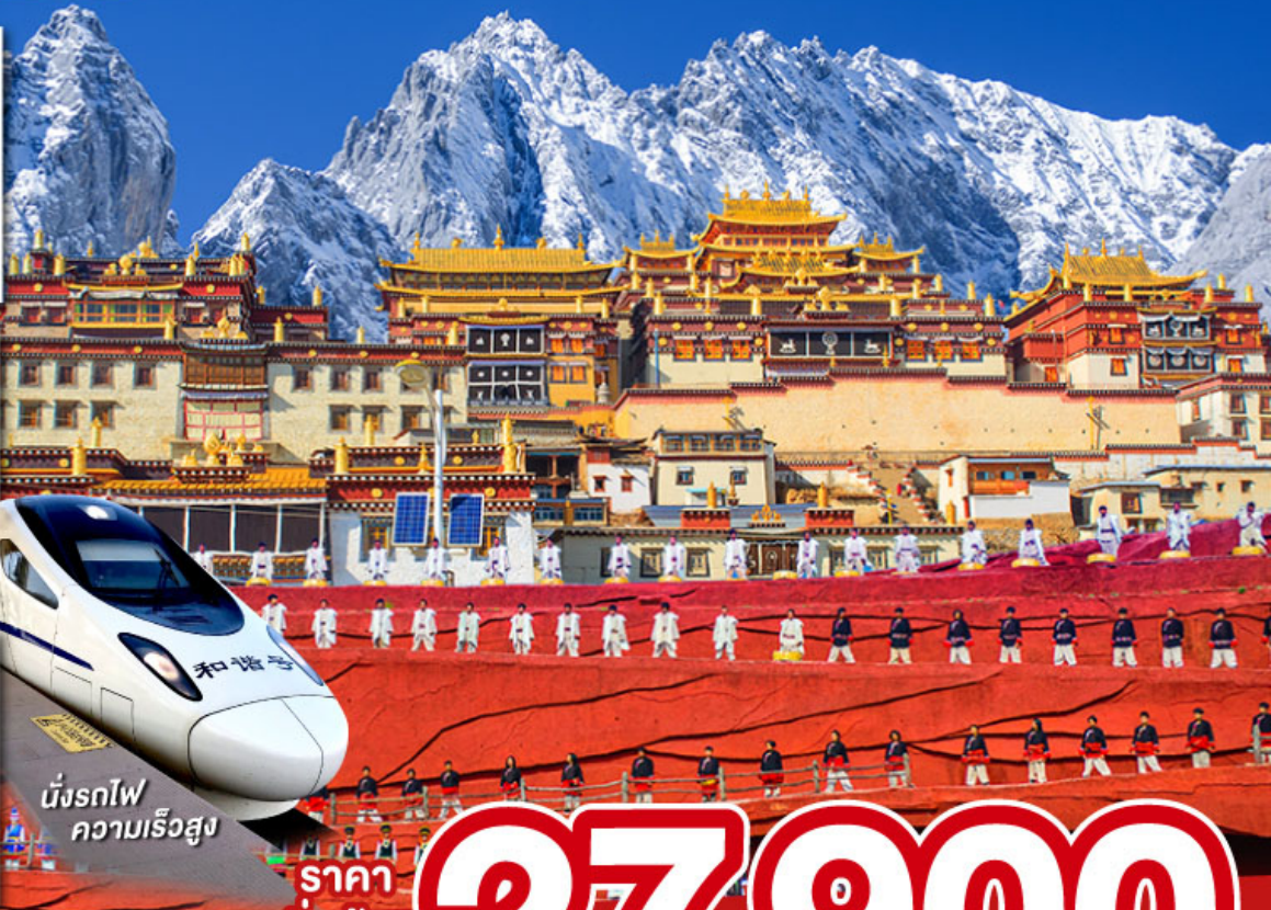
นั่งรถไฟ ความเร็วสูง