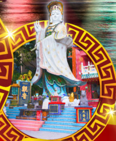
เจ้าแม่กวนอิม ทาดริ์ฟส์เบย์