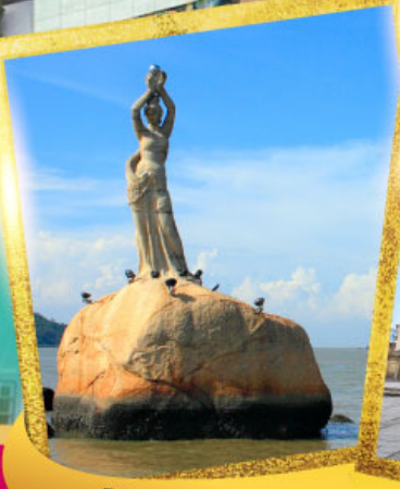
จูไห่พีชเชอร์เกิร์ล