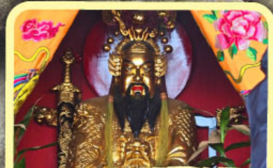
• เอียงบู๊ซัว (ศาลเจ้าพ่อเสือ)