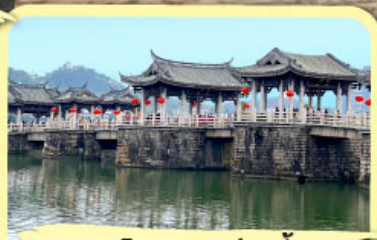
• สะพานโบราณกว้างจี้