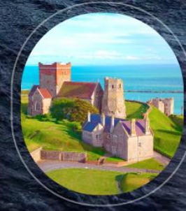
United Kingdom Dover

ราคารวม : อาหารทุกมื้อบนเรือสำราญ, ทิปพนักงานบนเรือ, ภาษีท่าเรือ | ราคาไม่รวม : ตัวเครื่องบิน, ค่าทำวีซ่า, ที่วีซ่าเสริมบนฝั่ง