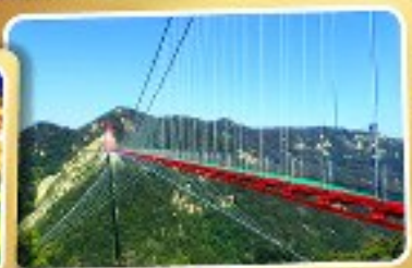
สะพานแวงอ้ายจ้าย