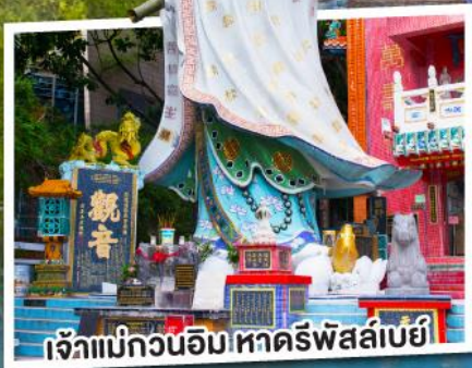
เจ๊กแม่กวนอิม หาดริพัลล์เบย์