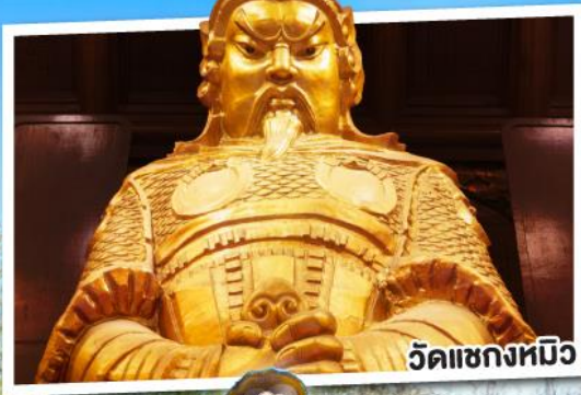
วัดเซ่งหมีว