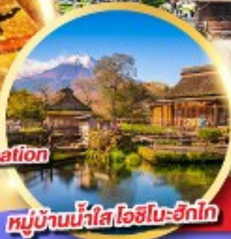
หมู่บ้านน้ำใส โอชิโนะฮัทสึ