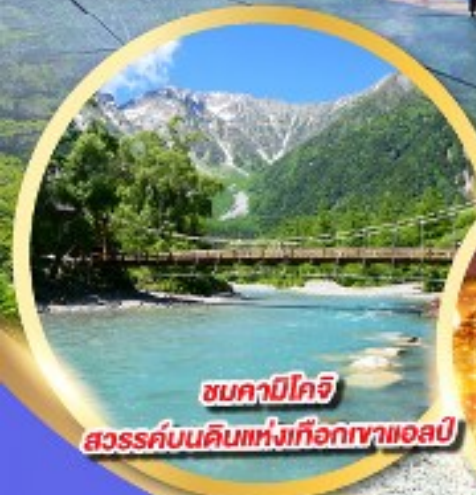
ชมคาบิโกจิ

นั่งกระเช้าลอยฟ้า 2 ชั้น ชินโฮทากะ หนึ่งเดียวในญี่ปุ่น แลนด์มาร์กยอดฮิตของโอคุซิดะ