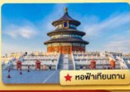
★ หอฟ้าเทียนถาน