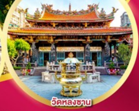
วัดหลงชาน