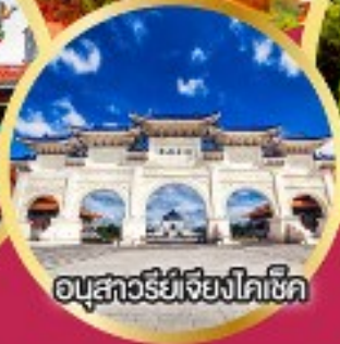
อนุสาวรีย์เจียงไคเช็ค