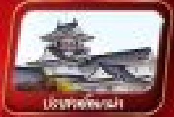
ไร่อินป่าฮากาธา