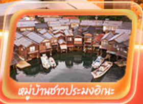
หมู่บ้านชาวประมงอิหะ