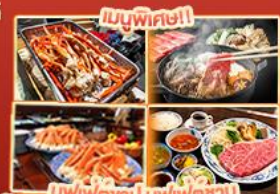
บุฟเฟ่ต์ญี่ปุ่น สเต็กคินโงะ สเต็กคินโงะ สเต็กคินโงะ