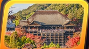
วัดคิโยมิสุเดระ