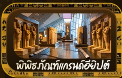
พีพีธกรัทท์แกรนด์อียิปต์