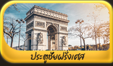
ประตูชัยฝรั่งเศส

พิเศษ!! ล่องเรือแม่น้ำแซนชมเมือง โดย บาโด มูช