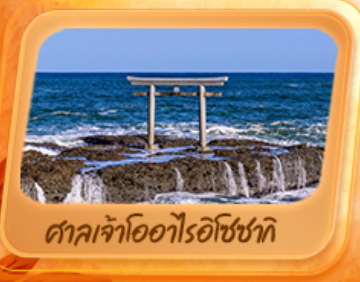
ศาลเจ้าโออาไรโอชิซาทิ

แพคเกจใกล้ชิด "ฟูจิซัง" ที่หมู่บ้านโอชิโนะ อักโท สวนโออิชิปาร์ค ที่เที่ยว Unseen นั่งกระเช้าชมวิวภูเขาฟูจิคุเบะ ศาลเจ้าโออาไรโอชิซาทิ เสาโทริอิริมทะเล อลังการใบไม้เปลี่ยนสี น้ำตกเคจอน ศาลเจ้านิกโกโทโชกุ เสรียมมงคล วัดพระใหญ่อุซึคุ ไดบุคสี ห้ามพลาดโคมแดงยักษ์ วัดอาซากุสะ อิมอร์ยอดตลาดปลาโทโยสุ ภัตตาคารแนว 3D ย่านชิจูกุ ซุปปิ้งจุกุ้ย่านดังชิบูย่า