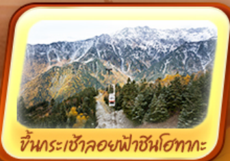
ขึ้นกระเช้าลอยฟ้าชินโศทากะ