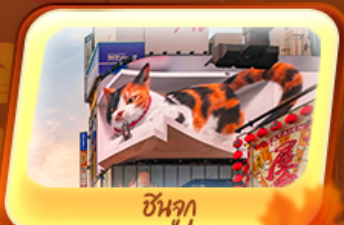
ชิบุจุกุ