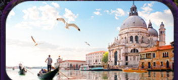
เวนิสเมืองแห่งสายน้ำ

พลอเรนซสติก, พิซซามากาเร็ตา, สปาเก็ตตีหมึกดำ, หอยยอสคาโท