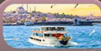
ล่องเรือ ช่องแคบบอสฟอรัส