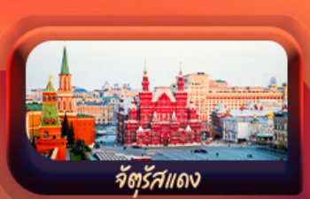
จัตุรัสแดง