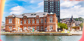
มิจิกะ เรสโตร