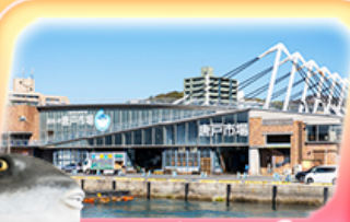
ตากาซากิออนเซ็น