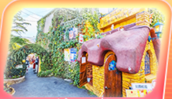
มียายามาออนเซ็น

สัมผัสกลิ่นอายญี่ปุ่นแท้ที่ศาลเจ้าดาไซฟู ของพรวัดนินโซอิน