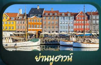
ย่านนูฮาวน์

Really want to see ... Scandinavia Sweden Norway Denmark