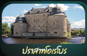
ปราสาทไอเรโบร