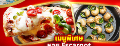
เมนูพิเศษ หอย Escargot Pizza Margherita 1 ถาด

อิตาลี มหาวहारดูโอโม่ ชมสิ่งมหัศจรรย์โลก โคลอสเซียม หอเอนปิซ่า สวิส พิษิตยอดเขาจุงเฟรา "TOP OF EUROPE" สะพานไม้ชาเปล รูปปั้นสิงโต ฝรั่งเศส เข็มอินปารีส หอไอเฟล ประตูชัย นั่งรถกระเช้าไฟฟ้ามงต์มาตร์ ล่องเรือแม่น้ำแซนชมเมือง ซ้อมบิงแบร์ดเต็มค่างปลอดภาษี เอากเล็ก