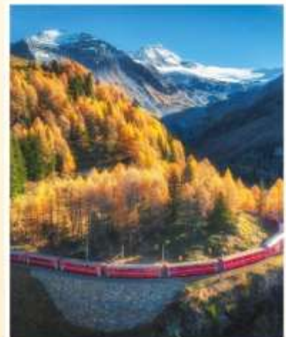
BERNINA EXPRESS GoldenPass Express