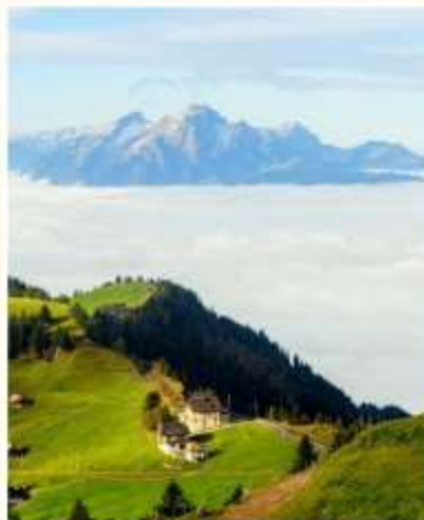
RIGI KULM Lucerne Cruise