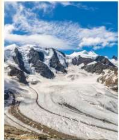
DIAVOLEZZA Piz Bernina Peak