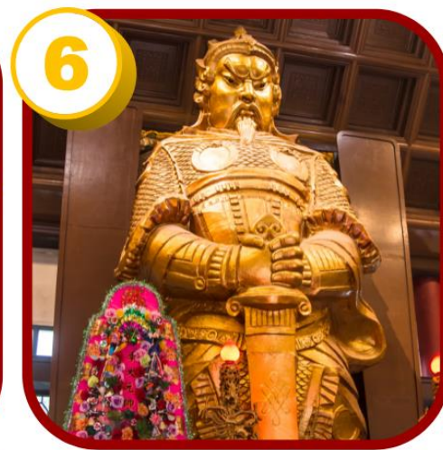
6 วัดแชกง (ซ่าถิ้น)