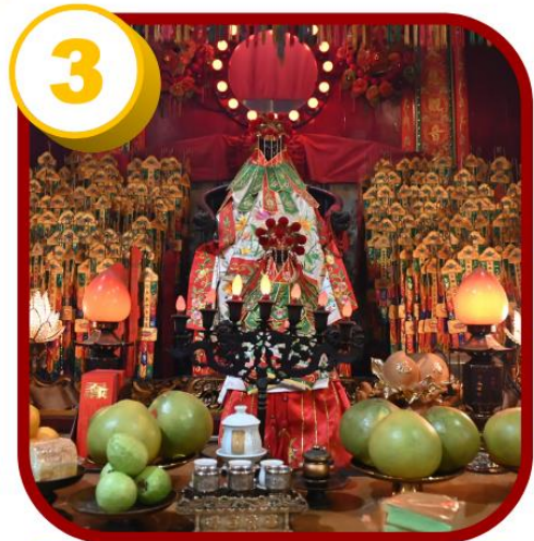
3 วัดเจ้าแม่กวนอิมสองห้า