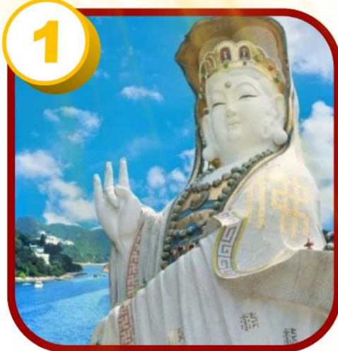
1 รัฟส์เบย์