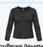
สวมฮีตเทค (Heattech) แบบหนาพิเศษด้านใน