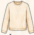
เสื้อแขนยาว