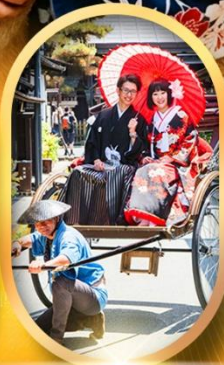
เมืองเก่ากาคายาม่า