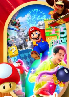
อิสระท่องเที่ยว หรือเลือกซื้อทัวร์เสริม USJ