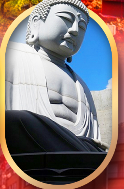
พระใหญ่อะตะมะ