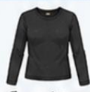
สวมฮีทเทค (Heattech) แบบหนาที่เคลือบด้านใน