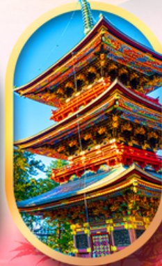
วัดนาริตะเซ็น