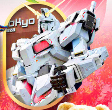
ห้างไอโดบะกันดั้ม