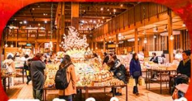
พิพิธภัณฑ์กล่องดนตรี Otaru Music Box Museum