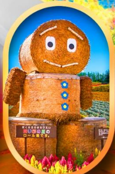
ซิกิโซ โนะโอะกะ