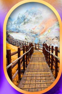
จิกุคคาบิ